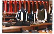
桃太郎ジーンズ児島味野本店