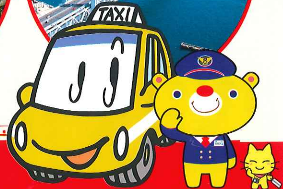
くまなく岡たぴにゃん